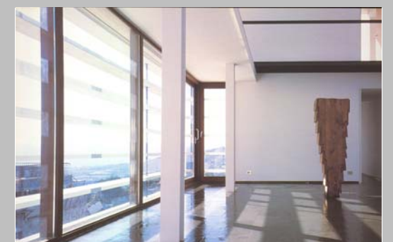
A képek nem erről az épületről készültek, nem képezik tárgyát a bérbeadásnak