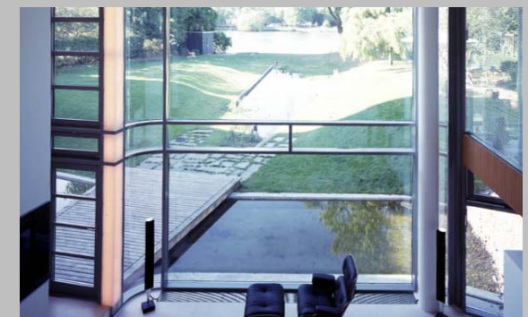
A képek nem erről az épületről készültek, nem képezik tárgyát a bérbeadásnak